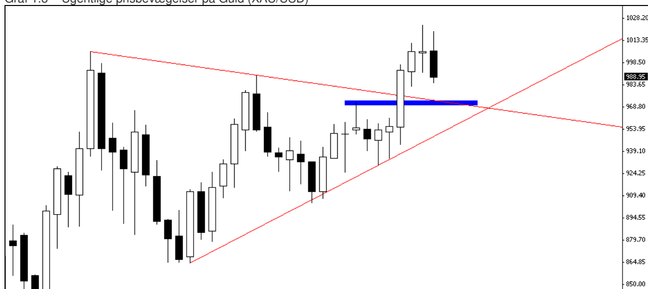
Graf 1.3 – Ugentlige prisbevægelser på Guld (XAU/USD)

Efter vi har nået en foreløbig top i kurs 1024 kunne noget tyde på at vi skal lidt lavere for at samle nye købere op. Trenden i markedet er fortsat dominerende opadgående og vi har senest set et brud ud og op af en konsoliderende trekantsformation. Noget kunne tyde på at markedet vil tilbage og teste denne brudte modstand og jeg tror området omkring kurs 970-972 som er markeret med blå kunne være interessant at holde øje med for en ny købsmulighed.