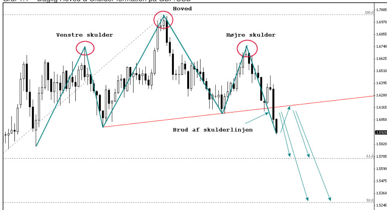
Graf 1.1 – Daglig Hoved & Skulder formation på GBP/USD

Ved disse tekniske prisformationer er der stor sandsynlighed for at markedet vender tilbage for at teste den brudte støtte, denne gang blot som modstand og derfor er der mulighed for at markedet stiger i den kommende uge og hvis modstanden holder (Ca. 1.6150) kan vi falde endnu lavere. Dvs. den Amerikanske Dollar vil blive yderligere styrket. Potentielle mål for dette fald ligger omkring kurs 1.5700 og 1.5300. Teknisk set er den dominerende opadgående trend derfor nu brudt og spørgsmålet er hvor langt ned vi skal.