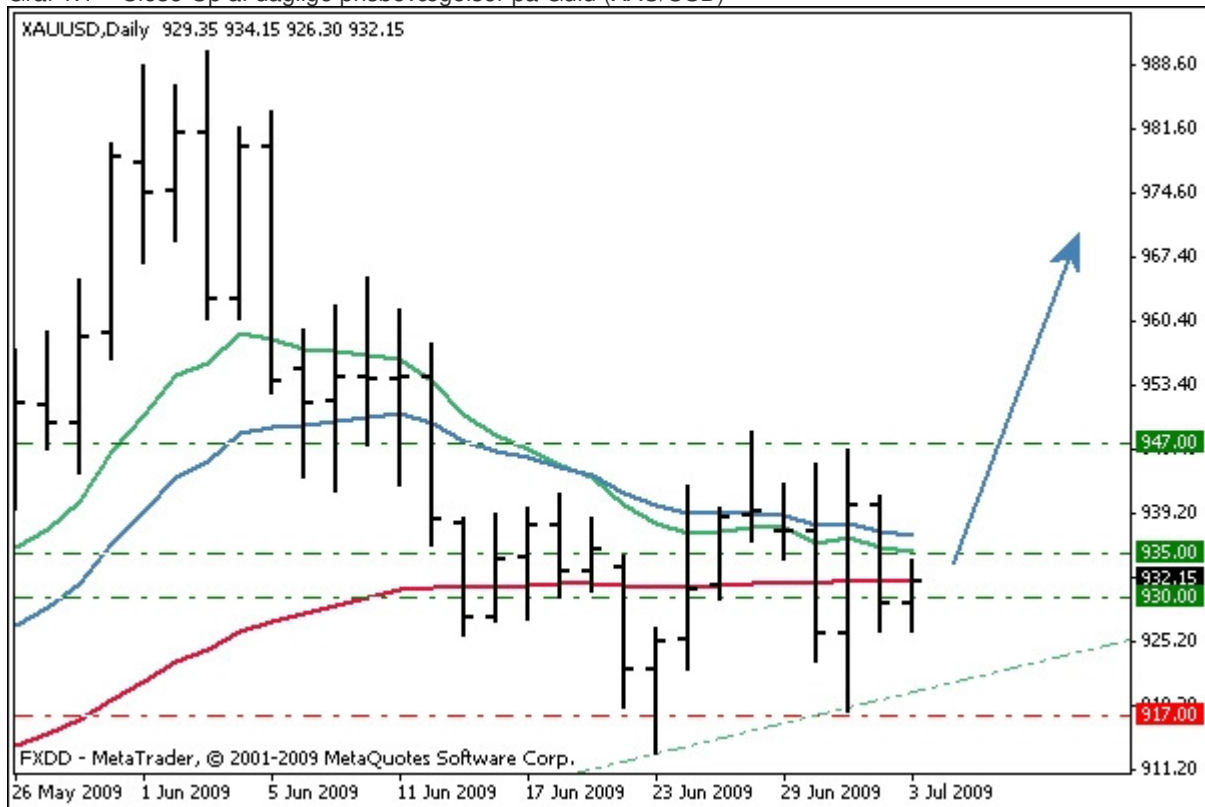
Graf 1.1 – Close-Up af daglige prisbevægelser på Guld (XAU/USD)

Jeg planlægger at anvende en samlet kapital risiko på 3% fordelt med 1% på hver af de tre ordrer. Det betyder at købet i kurs 930 vil have en afstand på 13 point ned til stop loss ordren, købet i kurs 935 vil have en afstand på 18 point og købet oppe i kurs 947 vil have en afstand på 30 point.