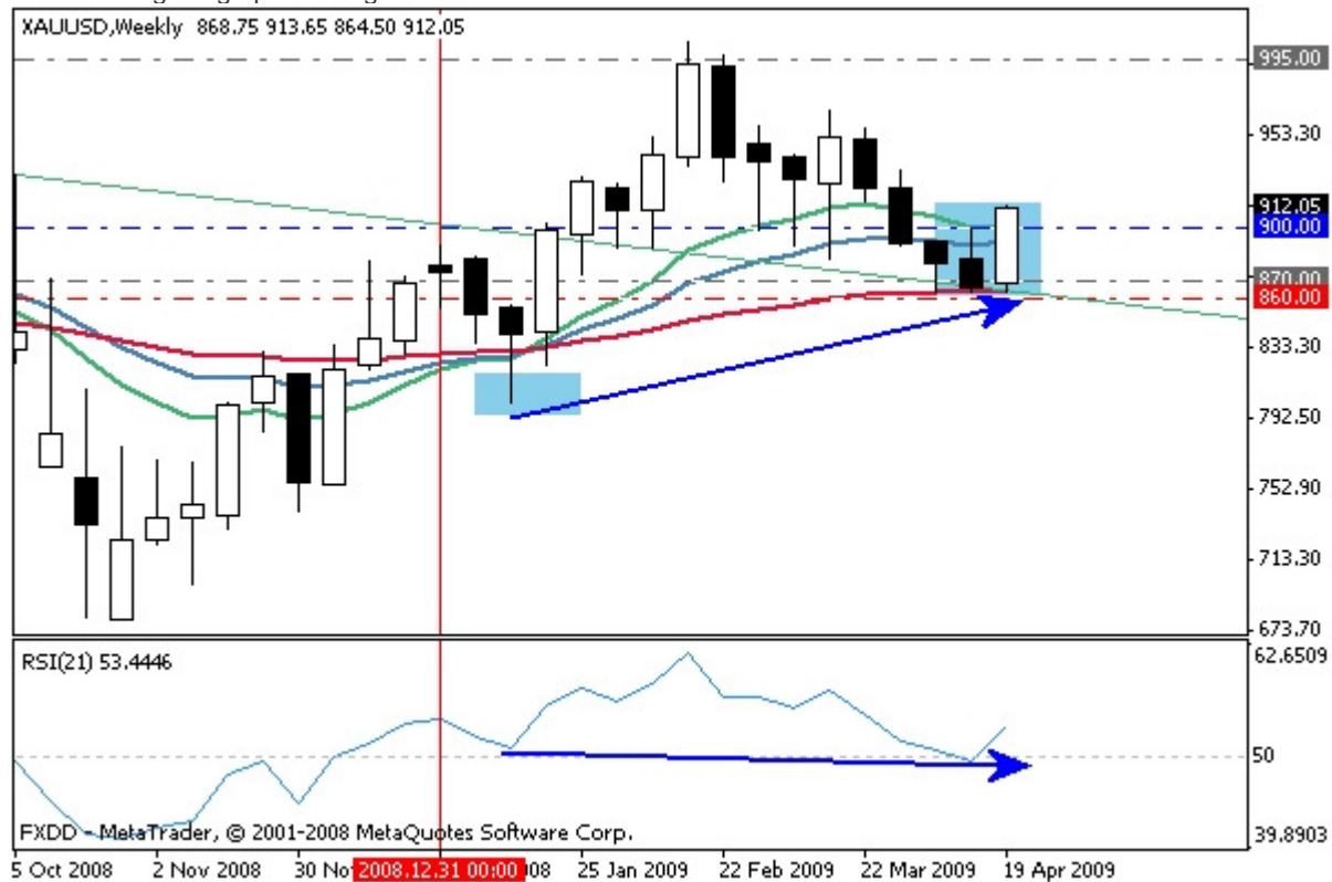
Graf 1.0 – Ugentlige prisbevægelser

Vi har nu fået de store tanker på plads og vi ved at der er stærke deflationære tendenser i Dansk økonomi. Vi ved at regeringen fører en Keynes' inspireret ekspansiv finanspolitik lige nu og forsøger at kickstarte forbrugernes købekraft i form af alverdens pakker og indgreb. Vores situation er meget lig den vi ser andre steder i verdenen og med de tendenser vi har set andre steder fra, er der stor sandsynlighed for at vi, i hvert fald på kort og mellemlangt sigt, vil se en stigning i opsparingen. En globalt stigende efterspørgsel på Guld som følge af en stigende opsparing virker derfor yderst plausibel så nu hvor vi kan argumentere at der fundamentalt er belæg for stigende efterspørgsel på Guld er det på tide at kigge på det tekniske billede af Guldmarkedet.