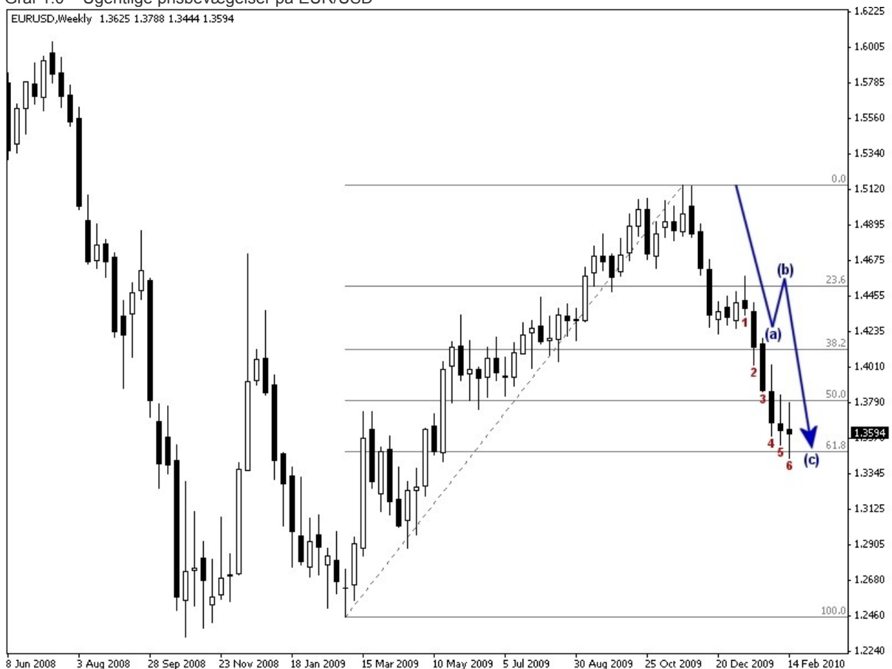
Graf 1.0 – Ugentlige prisbevægelser på EUR/USD

På graf 1.0 herunder ses billedet af de ugentlige prisbevægelser for EUR/USD. Jeg har i forhold til analysen fra 19. december 2009 korrigeret fibonacci korrektionsniveauerne lidt lavere, så de tager udgangspunkt i dobbeltbunden fra marts måned 2009 omkring kurs 1,2500 til toppen i slutningen af november 2009 omkring kurs 1,5100.